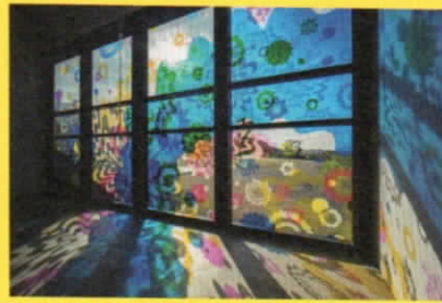
曾谷朝絵《鳴る色》2017年

「わわらかくなること」は、一見、弱くなることのようにも見えますが、そこには軸があっ てしなやかに変化したり、なにかを続けるために変容したりしていくものかもしれません。今回、 はじまりの美術館では、7組の作家によるわわらかさを感じたり体験したりできる様々な 作品をご紹介します。この展覧会が思考を柔軟にしたり、ふと息抜きをしたりするための ヒントになり、そのことが日々を生き抜くわわらかな強さにつながればと願います。