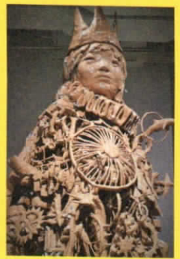
関口光太郎《王様 2020remix》2012年、2020年