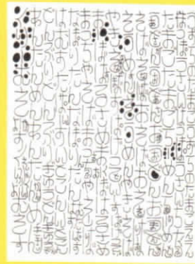
清水ちはる《心のまにに》2010年